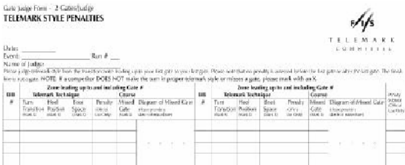
Illustrazione: Modulo di giudizio di porta tipico: due porte per giudice.

Nel giorno di gara verranno consegnati dei moduli di giudizio contenenti lo spazio per giudicare venti concorrenti; questi moduli saranno ritirati periodicamente durante la gara da un ufficiale nominato appositamente, in caso contrario devono essere restituiti all'ufficio di gara immediatamente dopo la gara stessa.